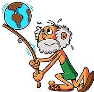
Figura 01 – O problema de Arquimedes

Antes de procurar a solução do problema preciso interagir com os alunos, que são alunos do curso de formação de professores do CEFET-PA, no intuito de descobrir quais são os assuntos que podem ser trabalhados com a introdução da situação problema, e quais os conhecimentos científicos que podem ser explorados. Essa interação pode ser através de uma pesquisa bibliográfica e posterior debate com a turma com objetivo de descobrir os conceitos físicos que podem ser trabalhados com o tema proposto.